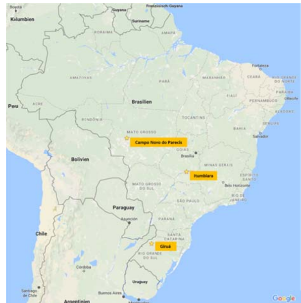
Abbildung 1: Lage der Untersuchungsgebiete in Brasilien

sich das Untersuchungsgebiet A um die beiden Ölmühlen von Campo Novo de Parecis (CNP). Über die zwei zentral und östlich gelegenen Bundesstaaten Minas Gerais und Goiás erstreckt sich das Untersuchungsgebiet B mit der Stadt Itumbiara und der dortigen Verarbeitung von Sonnenblumen im Mittelpunkt. Im Süden Brasiliens, an der Grenze zu Argentinien und Paraguay gelegen, ist Untersuchungsgebiet C mit der Ölmühle in Giruá im Bundesstaat Rio Grande do Sul anzutreffen. Die geographische Lage der Untersuchungsgebiete ist aus Abbildung 1 ersichtlich.